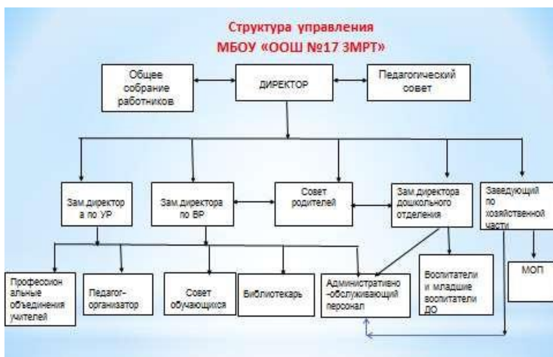
Рис. 1. Структура управления МБОУ «ООШ №17 ИМ. Н.А. Катина ЗМР РТ»

Управление школой осуществляется в соответствии с образовательными программами, планом внутришкольного мониторинга качества образования и функциональными обязанностями членов педагогического коллектива, годовым планом работы школы, совместными планами работы с учредителем. К структуре и содержанию управленческой деятельности школы отнесены организация функционирования учебного процесса, внеурочной и внешкольной воспитательной работы, адаптивно-коррекционной и профилактической деятельности, правового регулирования взаимоотношений обучающихся, их родителей (законных представителей) и педагогов, обеспечение необходимых психологических, бытовых и санитарногигиенических условий, осуществление единичных и системных нововведений.